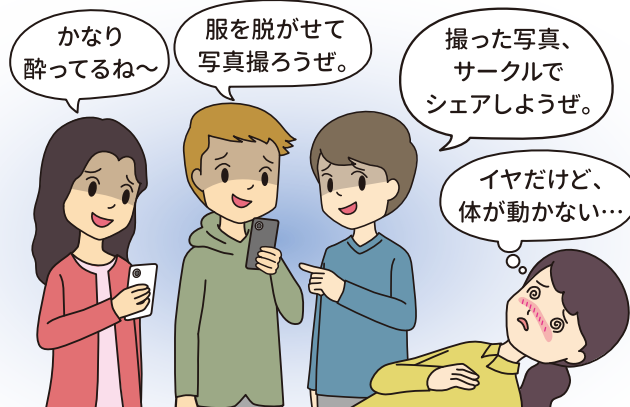
裸の写真を撮られてしまった・・・