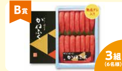
B賞 辛子明太子一本物2L 1kg (500g×2袋) 3組 (6名様) 協賛: めんたいパーク群馬