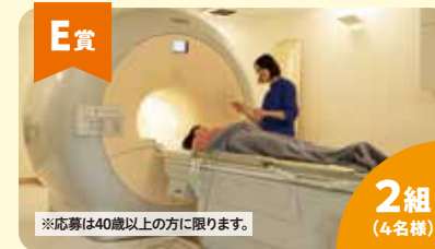
E賞 脳ドック招待券 2組 (4名様) 協賛: 医療法人社団美心会 黒沢病院 群馬県がん対策連携企業