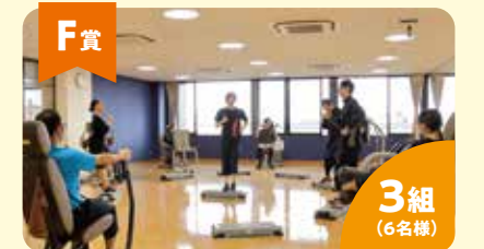
F賞 メディカルフィットネス&スパ Valeo Pro 一日券 3組 (6名様) 協賛: 医療法人社団美心会 黒沢病院 群馬県がん対策連携企業