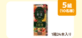
5組 (10名様) きになる野菜100餐沢野菜1日分 1箱24本入り 協賛: 群馬ヤクルト販売(株) 群馬県がん対策連携企業