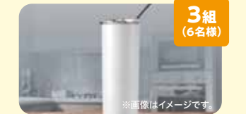
3組 (6名様) 有名コーヒーショップタンブラー 協賛: 第一生命保険(株)群馬支社 群馬県がん対策連携企業