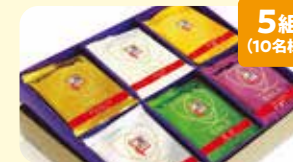
5組 (10名様) プレミアムゴールド旅がらす 30個入り 協賛: 旅がらす本舗 清月堂