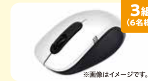
3組 (6名様) ワイヤレスマウス 協賛: 第一生命保険(株)太田支社 群馬県がん対策連携企業