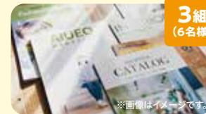
3組 (6名様) カタログギフト 協賛: (株)群馬銀行 群馬県がん対策連携企業