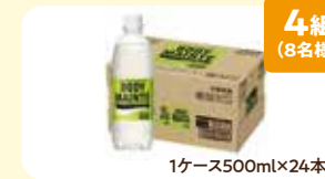
4組 (8名様) 大塚製薬「ボディメンテドリンク」 1ケース500ml×24本 協賛: (株)クスリのマルエ 群馬県がん対策連携企業