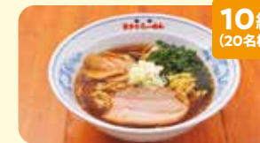
10組 (20名様) 食事金券(500円3枚1組) 協賛: 会津 喜多方ラーメン新田店 群馬県がん対策連携企業