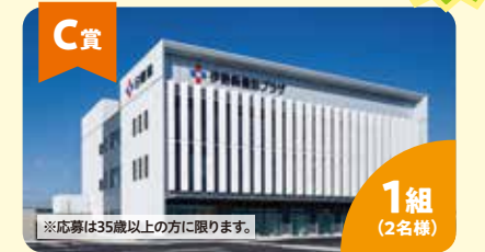
C賞 人間ドック招待券 1組 (2名様) 協賛: (一財)日本健康管理協会 伊勢崎健診プラザ 群馬県がん対策連携企業