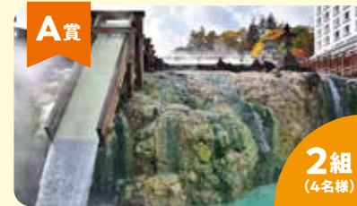
A賞 県内温泉旅館宿泊券 (お一人様10,000円分) 2組 (4名様)