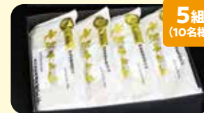
5組 (10名様) うどん茶屋水沢万葉亭 水沢うどん 8人前 詰め合わせ 協賛: うどん茶屋水沢 万葉亭