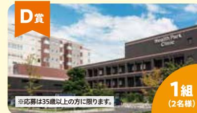
D賞 人間ドック招待券 1組 (2名様) 協賛: 医療法人社団美心会 黒沢病院 群馬県がん対策連携企業