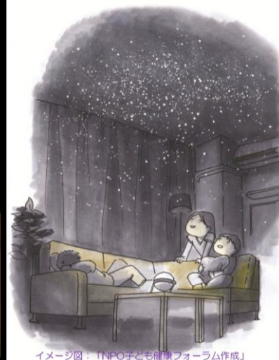
イメージ図：「NPO子ども健康フォーラム作成」