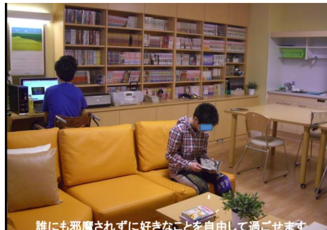
誰にも邪魔されずに好きなことを自由して過ごせます