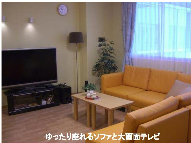
ゆったり座れるソファと大画面テレビ