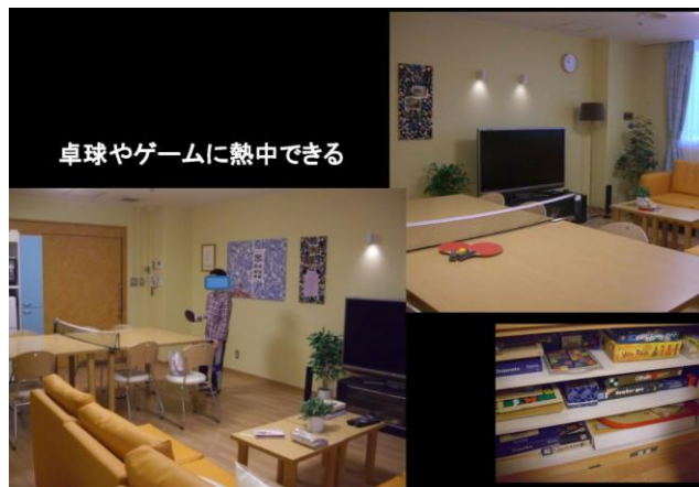
卓球やゲームに熱中できる