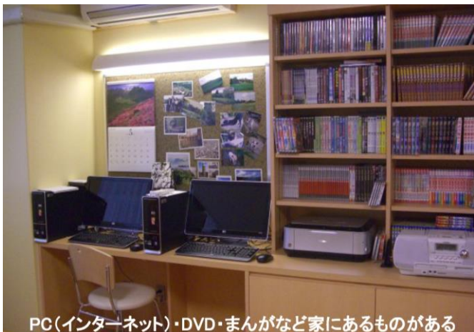
PC(インターネット)・DVD・まんがなど家にあるものがある