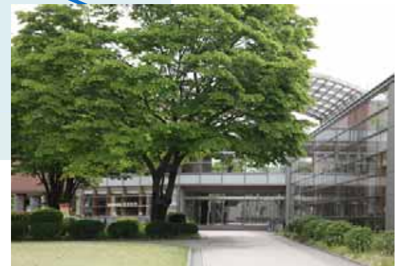
学生会館 (学食・購買・ホール)