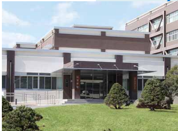
共同教育学部玄関