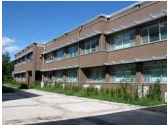
共同教育学部講義棟