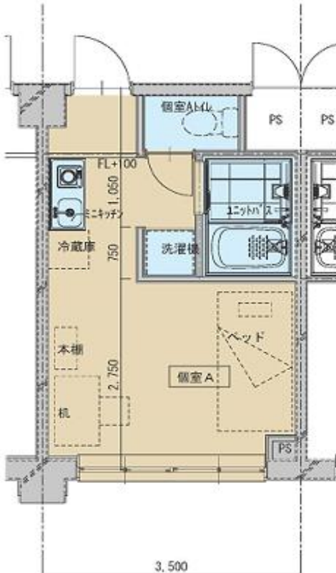
個室A詳細図 (改修後) S=1/50