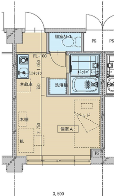
個室A詳細図 (改修後) S=1/50