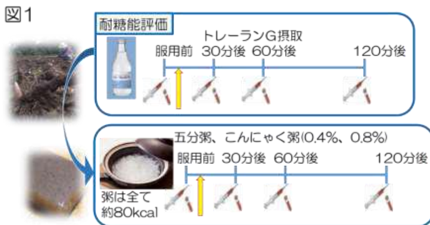
図1に示すように、各被験者に3種類の粥（五分粥、0.4%こんにゃく粉入り粥、0.8%こんにゃく粉入り粥。いずれも約80kcal）を食べてもらい、摂食前と摂食後30分、60分、120分の時点で血糖値とインスリンを測定しました。本研究では、37～60歳の健康男性25人のボランティア（被験者）に対して糖尿病の診断に用いられる75g経口糖負荷試験を行った結果、8人が健康者、17人が糖尿病予備群でした。

その結果、図2に示すように、五分粥にこんにゃく粉0.8%を加えたことにより食後30分にピークとなる血糖値とインスリンの上昇が抑制されました。一方で、その他の時間（食前、食後60分、120分）においては、両群の間に血糖値とインスリンの差は認められませんでした。