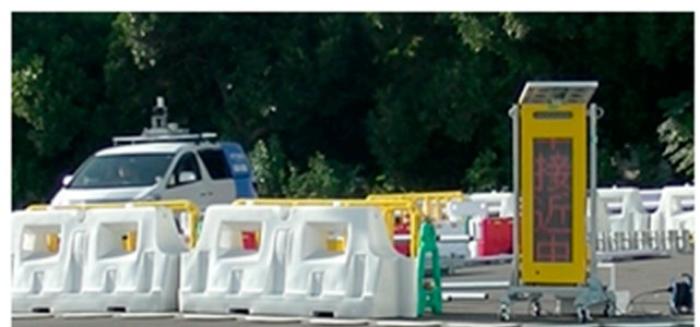
■「路車間協調表示装置」が、自動運転車両の意思を周囲に伝えている様子(群馬大学次世代モビリティ社会実装研究センターにて)

群馬大学とアークノハラは、自動運転車両が本当の意味で社会に受け入れられるためには、自動運転車両の知能化に加えて、道路や街側の賢さを向上させ、社会全体のバランスを重視していく必要があると考えています。アークノハラは「安全安心な街づくりに貢献すること」をミッションに、長年、標識や道路安全施設などの公共インフラに注力してきたプロ集団です。アークノハラは、あらゆるものがネットにつながるIoTと組み合わせた、自動運転車両と道路側の連携を行う路車間協調という考えに基づき、これまでの知見を群馬大学との共同研究に活かしてまいります。