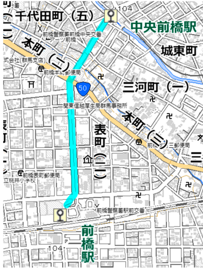
国土地理院の電子地形図（タイル）に走行ルートを追記して掲載