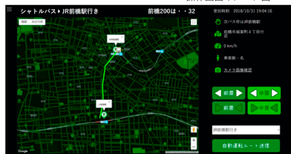
操作画面イメージ図

走行ルート指示・走行状態監視・乗降ドア開閉など、自動運転バスの安全な運行をサポートするための運行管制システム