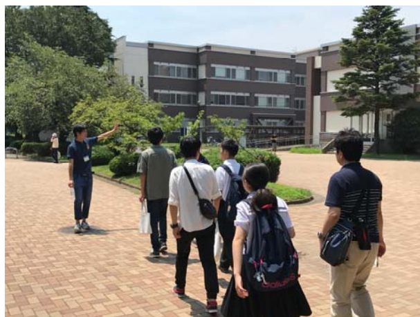
「GU'DAY2017」キャンパスツアーで案内する学生広報大使