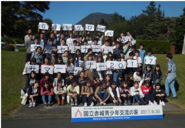
▲グローバル交流セミナー・サマーセミナー

や、「グローバル交流セミナー・サマーセミナー」、外国人教員による特別プログラムにより、幅広い国際的視野と語学力を身に付けます。