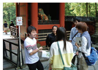
海外研究者をGFL学生がガイド役を務め日光を案内

今後のプログラムとして、先端研究紹介講座、トップリーダーによる講演会、外国人教員による英語による講義、インテンシブイングリッシュ(海外留学準備講座)などにより、日本語能力・国際理解を含む幅広い教養・外国語コミュニケーション能力の習得を中心とした教育を行うとともに、海外留学を経験することにより幅広い視野