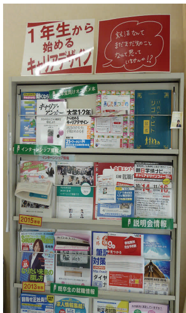
1年生から始めるキャリアデザイン についての各種情報もあります キャリアサポートセンター (荒牧キャンパス)