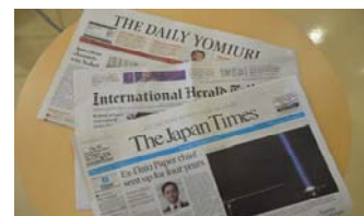
リフレッシュコーナー(荒牧図書館)