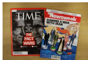
2Fブラウジング(荒牧図書館)