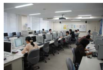
ラーニングルーム (総合情報メディアセンター)