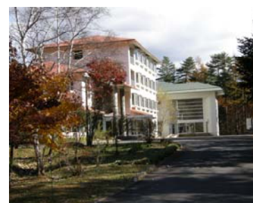
草津セミナーハウス全景