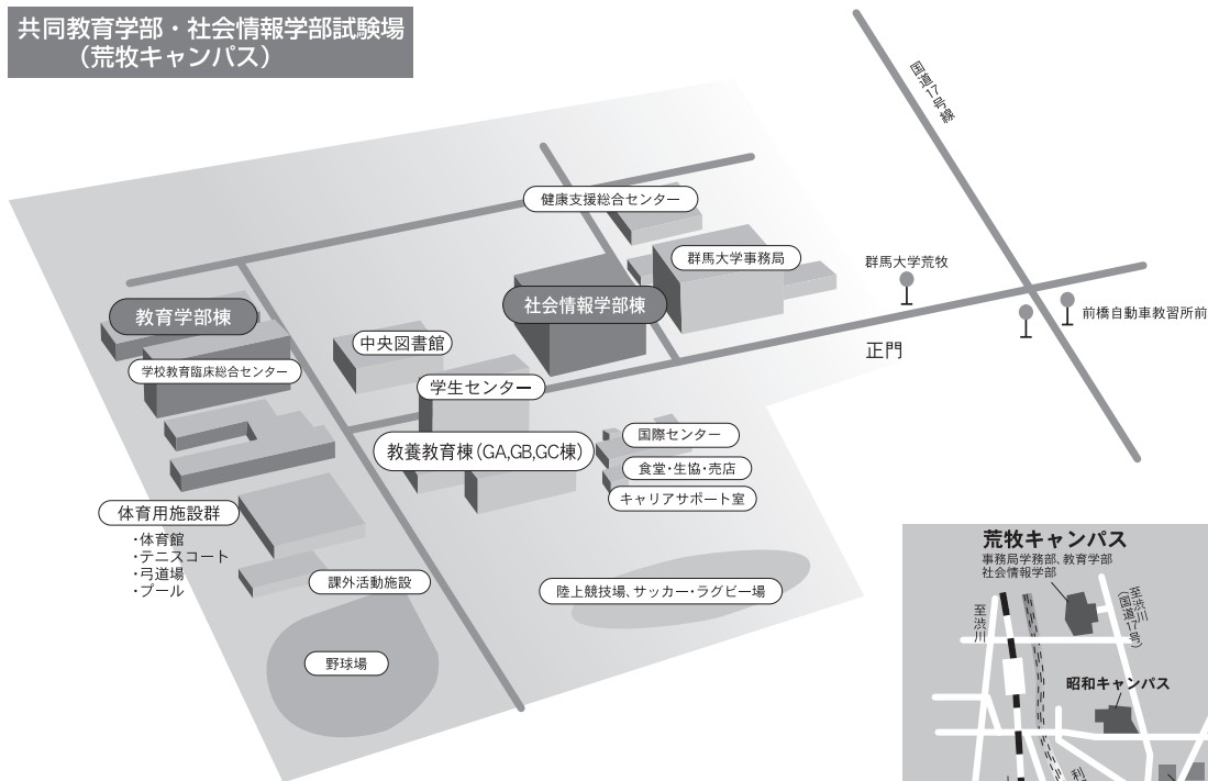
共同教育学部・社会情報学部試験場 (荒牧キャンパス)

※ 公共交通機関の運行状況は必ず最新の情報を確認し、集合時刻までに到着できるよう十分に余裕を持って試験場へお越しください。