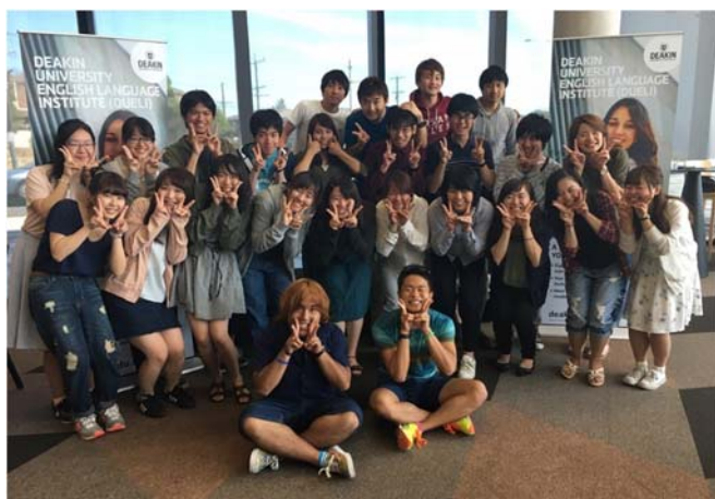
▲オーストラリア・ディーキン大学短期留学

GFLでは、通常授業以外に多彩なプログラムが受講できます。例えば、早期から専門領域に触れられるよう「特別講演会」や「企業訪問&先輩ゼミ」などがあります。