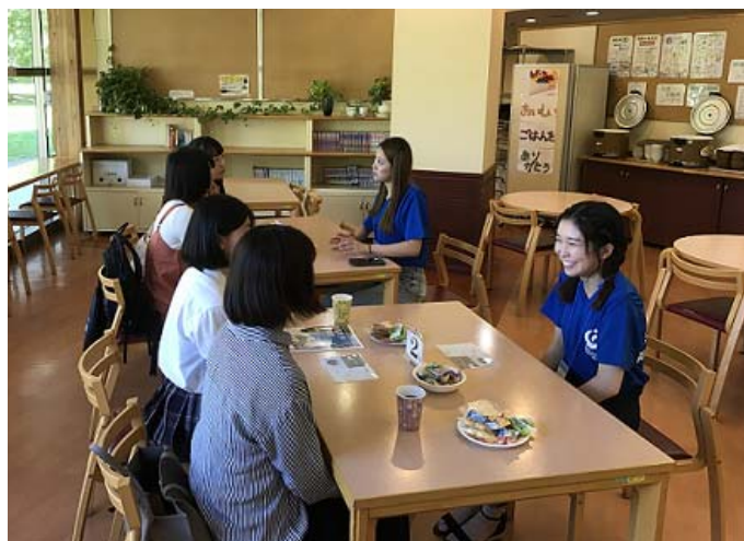
オープンキャンパスで、高校生の質問にお答えします。