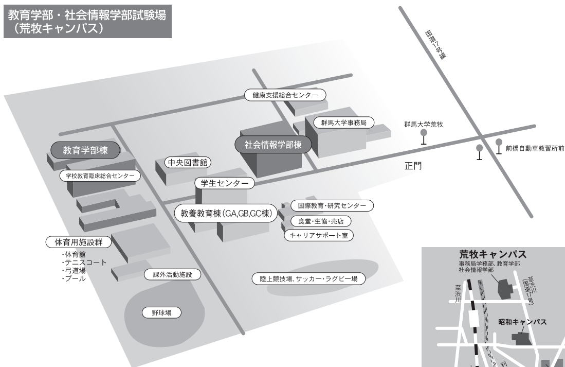
教育学部・社会情報学部試験場 (荒牧キャンパス)

※ 公共交通機関の運行状況は必ず最新の情報を確認し、集合時刻までに到着できるよう十分に余裕を持って試験場へお越しください。