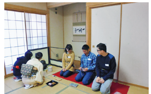
日本文化体験授業（茶道）